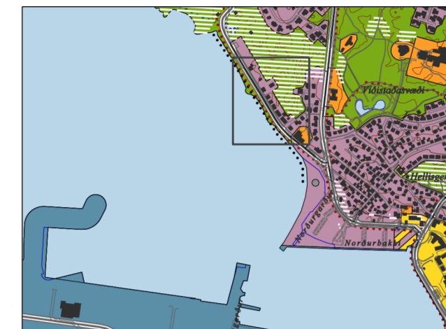
Hluti af Aðalskipulagi Hafnarfjarða 2005-2025

Deiliskipulagsbreyting þessi hefur fengið meðferð í samræmi við 1. mgr. 43. gr. skipulagslaga nr. 123/2010 og var samþykkt í skipulags- og byggingarráði Hafnarfjarðar þann _____2014